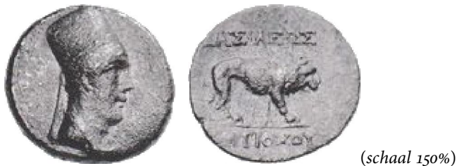
Fig. 1 – Commagene – Antiochus I Theos, 69-34 BCE

Het was wachten tot een munt opdook waarop het nieuwe hoofddeksel duidelijk stond afgebeeld. Deze afbeelding van een “tiara met een platte top” wijkt sterk af van de afbeelding op munten van zijn vader Mithradates I (130-109 BCE) en zijn grootvader Samos II (96-70 BCE) met de conische bashlik . Antiochus I pretendeert hiermee een hogere status. De afbeelding van de koning met een platte tiara werd mogelijk overgenomen van de munten van het naburige koninkrijk Sophene, waar het gebruik van zulke tiara in zwang was.