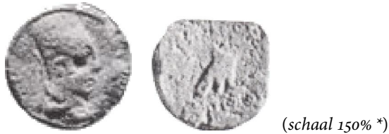
Fig. 2 – Commagene – Antiochus I Theos, 69–34 BCE

De afbeeldingen van leeuw (zodiacaal) en arend (attribuut van Zeus) zijn ook terug te vinden op Nemrud Dagh, zij flankeren er de tronende godenbeelden.