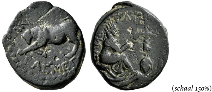
Fig. 9 – Commagene – Antiochus I Theos, 69–34 BCE

Samosata 63–34 BCE, ⅈ octochalcus, 27 mm, 17,36 g, Ɱ, uniek ex. (Leu 1/98).